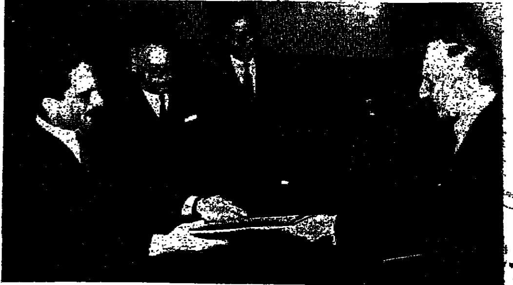
جلالة الملك العظيم يقبل اوراق اعتماد اسفير القما بحضور وزير البلاط ووزير الدولة للشؤون الخارجية